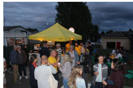
belle fin de soirée

Et ce n'est pas fini, mon équipe et moi avons décidé cette année d'organiser un après-midi cabaret qui aura lieu le dimanche 7 juin 2026 à 14h00. Nous comptons sur votre présence pour passer un bel après-midi !!!